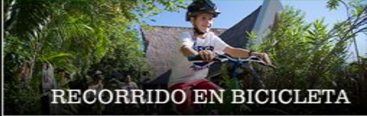
RECORRIDO EN BICICLETA