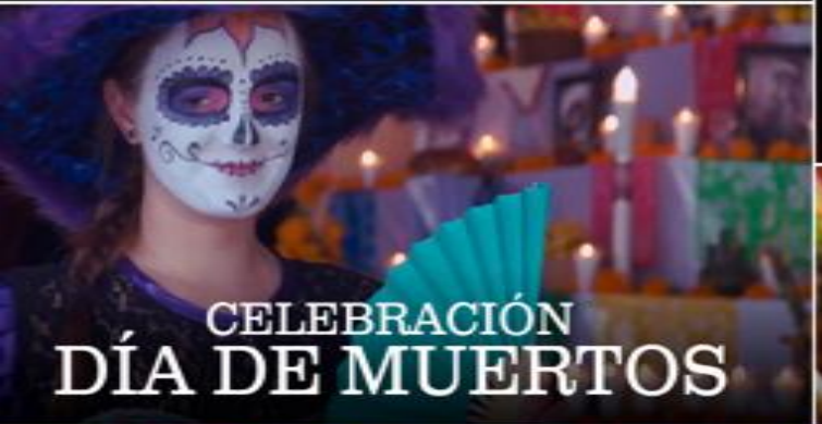
CELEBRACIÓN DÍA DE MUERTOS