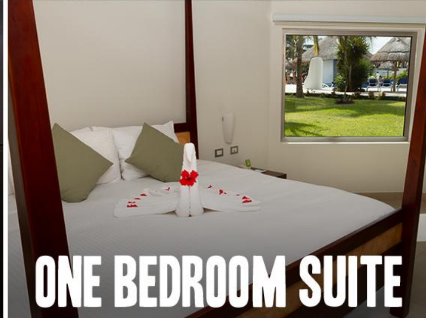
ONE BEDROOM SUITE