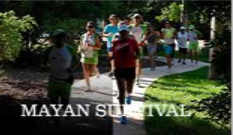
MAYAN SUN FESTIVAL