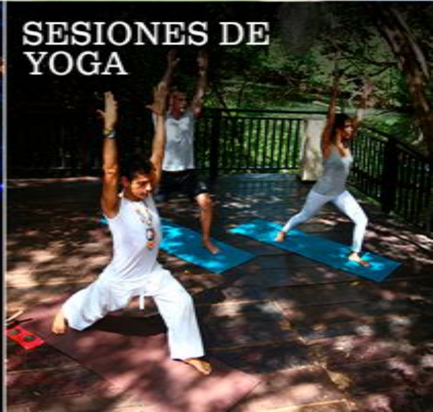
SESIONES DE YOGA