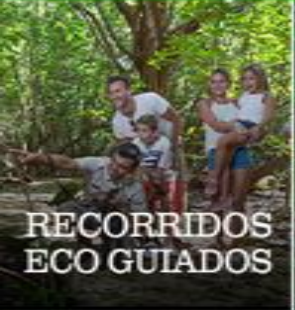
RECORRIDOS ECO GUIADOS