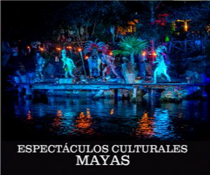
ESPECTÁCULOS CULTURALES MAYAS